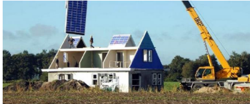
Proep: minder nieuwbouw in Roden

RODEN - De vereniging Groen Noordenveld vindt dat het plan voor de bouw van drieduizend huizen bij Roden van tafel moet.